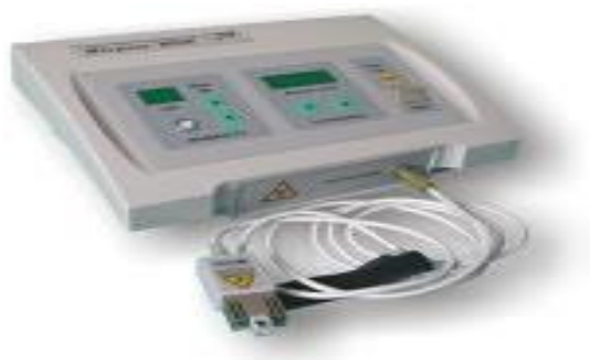
Рис.1 Аппарат лазерный терапевтический «Матрикс»

только созданием экспериментальной установки. Используемые тогда газовые лазеры были громоздки, дороги и ненадежны. Надеемся, что созданные новые лазерные терапевтические аппараты на основе диодных лазеров в данном спектральном диапазоне позволят расширить применение ВЛОК и повысить эффективность метода. Подробнее этот вопрос рассмотрен в других разделах.