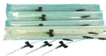
Рис.3 Одноразовый световод с иглой для ВЛОК.

В настоящее время используется прямой ввод излучения в световод от излучающей головки, что позволяет сохранить поляризацию и когерентность лазерного излучения, следовательно, повысить эффективность лечения. Специальные одноразовые стерильные световоды с иглой КИВЛ-01 производства Научно-исследовательского центра «Матрикс» для проведения ВЛОК (рис.3) поставляются отдельно по мере необходимости. Срок гарантированной стерильности световодов – 2 года. К вопросу о травматичности процедуры ВЛОК: действительно, трудно себе представить, чтобы световод в игле не повредил стенки сосуда, находясь в нем достаточно долго. Однако, как показали исследования И.М. Байбекова с соавт. (1991), при внутривенном лазерном облучении крови хотя и возникают естественные повреждения эндотелия, но одновременно происходит быстрое восстановление эндотелиальной выстилки сосуда как следствие влияния НИЛИ на репаративную способность. Образование тромбов в зонах повреждения при этом не отмечено. Применение современных одноразовых стерильных световодов с иглой, разработанных С.В. Москвиным (Пат. 2252048 RU), которые выпускаются Научно-исследовательским центром «Матрикс», делает процедуру ВЛОК максимально комфортной и абсолютно безопасной.